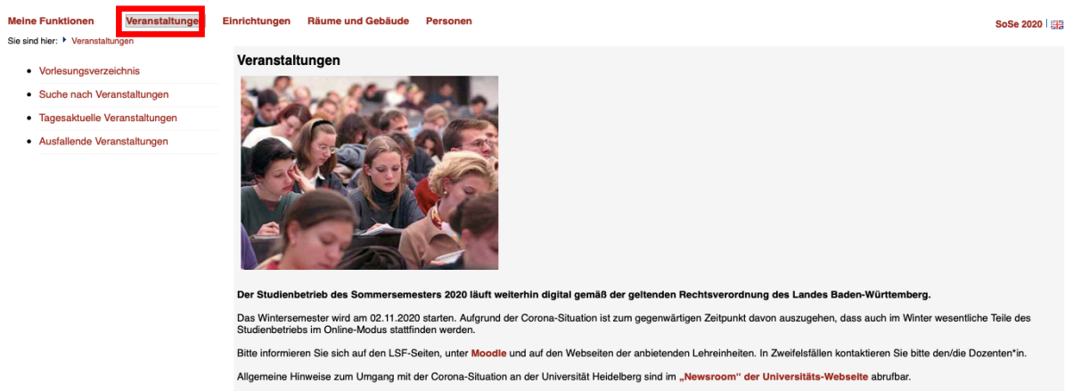
Abbildung 2: Aufruf Veranstaltungen LSF